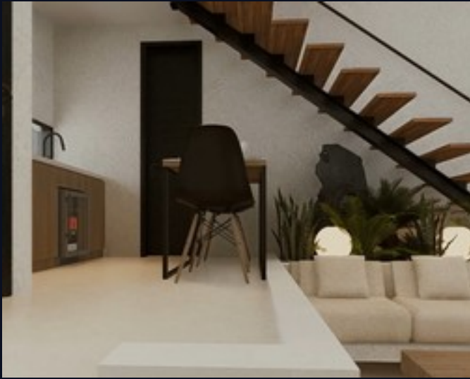
Salón y escalera flotante · planta baja

Cada villa distribuye sus 50 m 2 en dos plantas. La planta baja integra salón, cocina y baño completo alrededor de un patio interior con vegetación; la planta superior alberga el dormitorio principal y vestidor en formato loft abierto, conectados por una escalera flotante de madera. Acabados en microcemento, madera tropical y piedra natural.