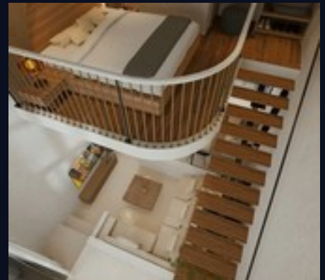
Vista aérea · distribución de dos plantas