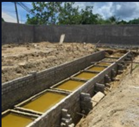
Piscina lineal · cimentación y muros de bloques

Ejecución del armado de pilares con barras de acero y entibación de bambú, cimentación de la piscina lineal con muros de bloques ya terminada y avance de las zanjas estructurales de las villas. El complejo avanza según calendario para la entrega en febrero de 2027.