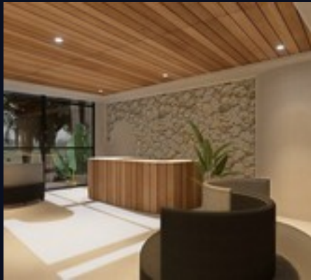
Recepción · mostrador de madera y muro de piedra natural

Renders oficiales · Recepción, restaurante y lobby