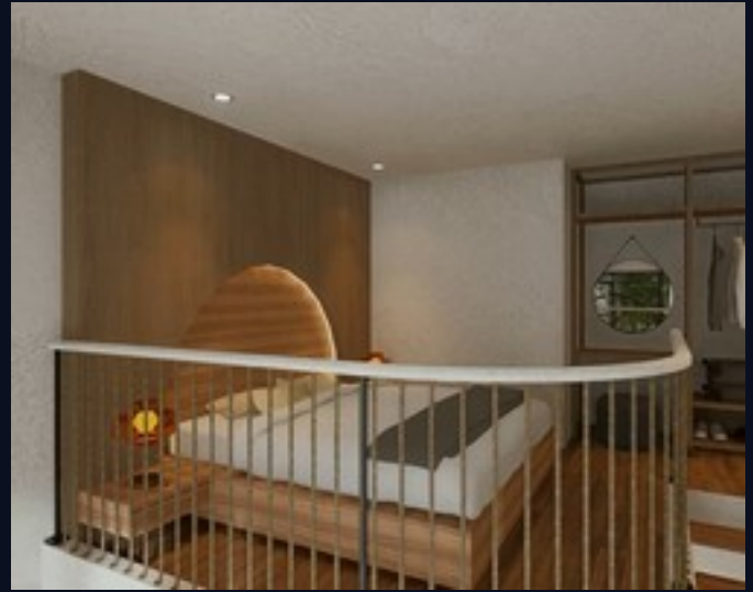
Dormitorio y vestidor · planta superior