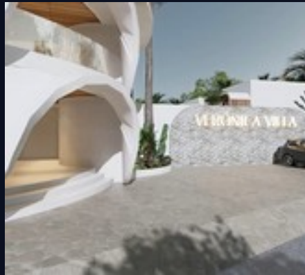
Lobby · vista amplia de recepción con techo de madera