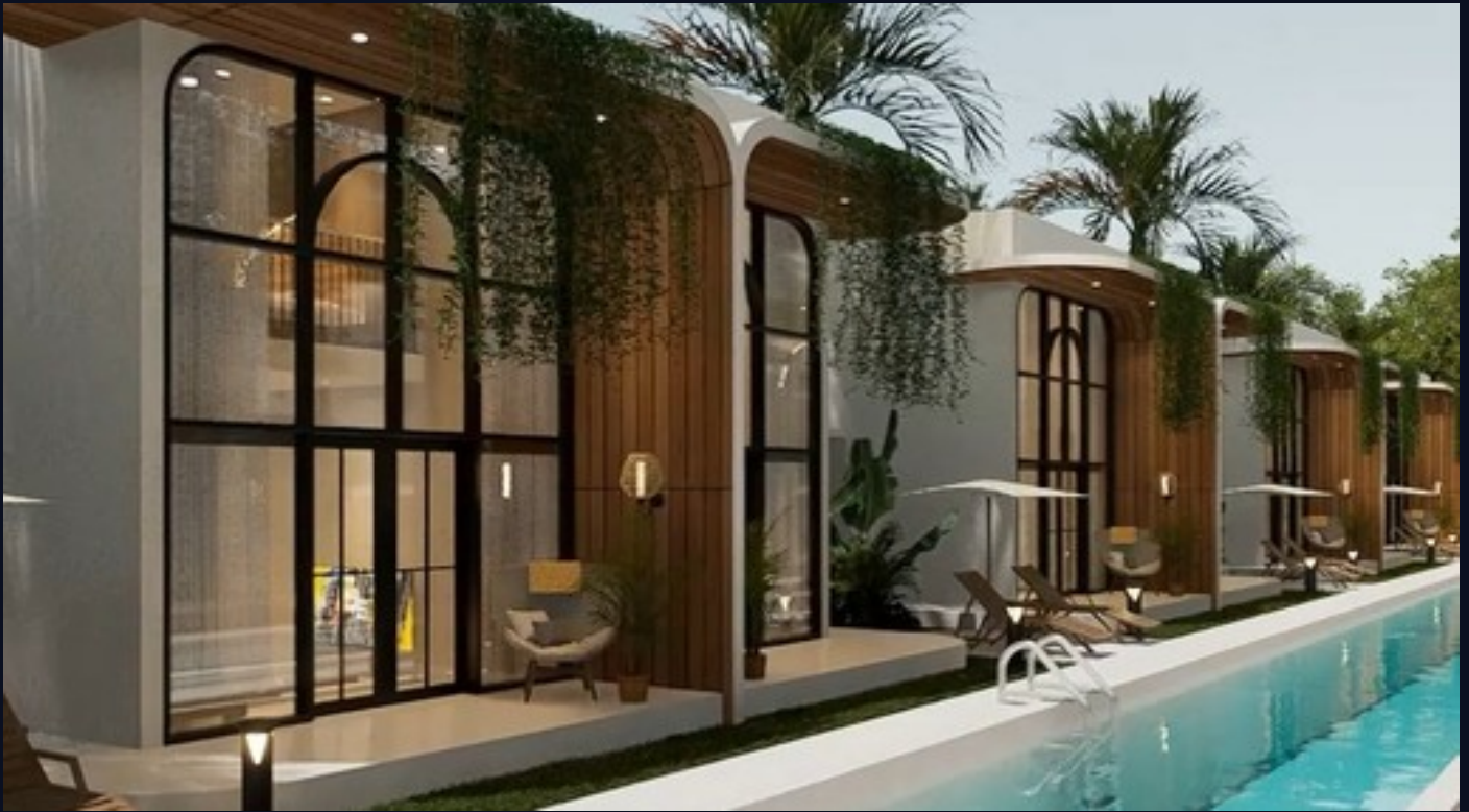
Vista general · piscina comunitaria lineal y villas · Render oficial

Renders oficiales · Vista general del complejo, piscina lineal y villas