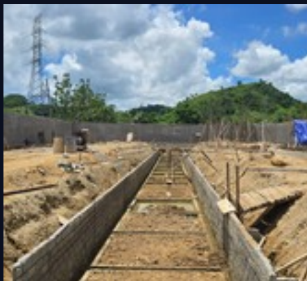
Cimentación de piscina · vista longitudinal con armado