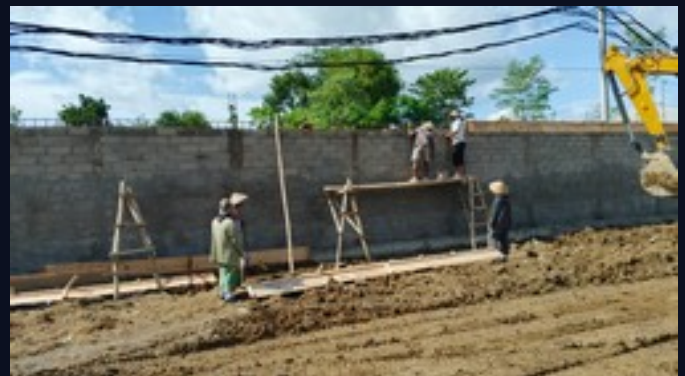
Muro perimetral · operarios sobre andamios de bambú