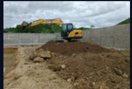
Movimiento de tierras · excavadora en acción