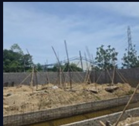
Pilares armados con bambú · vista lateral de obra