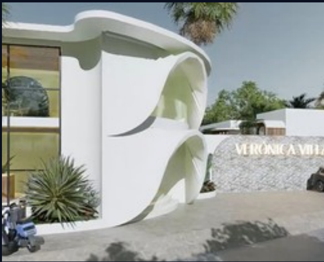
Fachada principal · entrada del complejo · arquitectura orgánica blanca