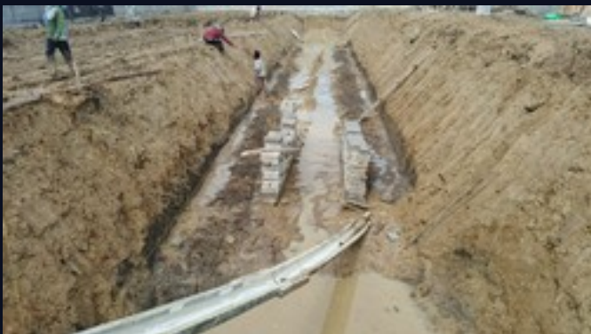
Zanja de cimentación de la piscina · colocación de base

Excavación de zanjas para la cimentación de la piscina comunitaria lineal, colocación de ladrillos batako como base e instalación del muro perimetral de bloques de hormigón que delimita todo el complejo. El equipo de obra trabaja en paralelo en múltiples zonas.