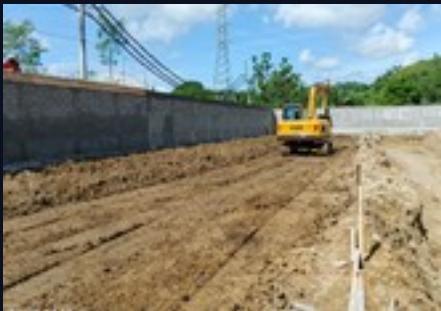
Excavadora XCMG · elevación del terreno · Ene 2026

Las obras se iniciaron con la excavación y nivelación del terreno, la elevación del suelo con tierra de aporte, la instalación de servicios básicos y el acondicionamiento perimetral mediante un muro de contención de piedra local. Los primeros movimientos de tierra marcan el inicio oficial del proyecto.