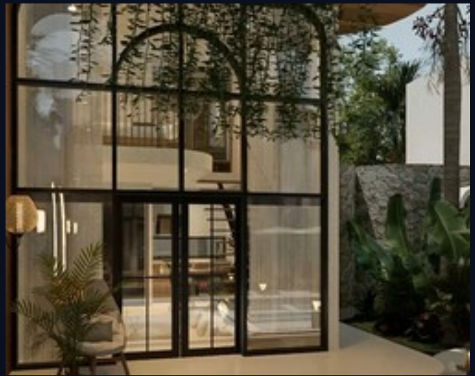
Villa individual · grandes ventanales y vegetación tropical