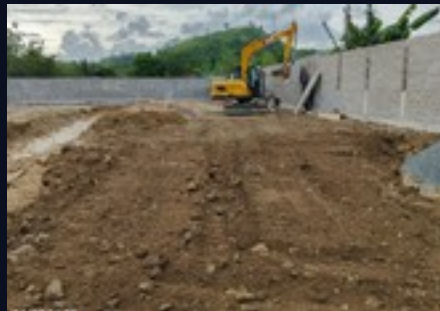
Nivelación del terreno · progreso de elevación