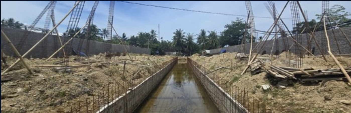
Vista panorámica · armado de pilares y cimentación · Abril 2026

Avance significativo en la cimentación de la piscina comunitaria lineal — elemento central del diseño del complejo — con muros de bloques ya ejecutados y armado en progreso. Vista panorámica de la obra mostrando el avance global de las excavaciones y primeras cimentaciones de villas a lo largo del perímetro.