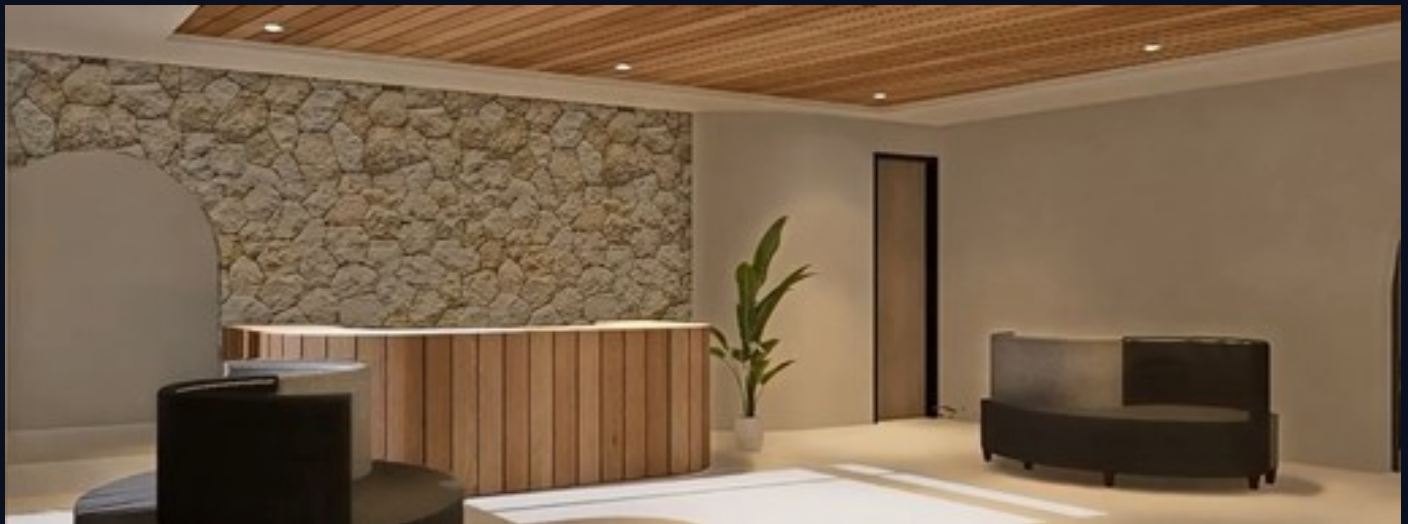
Acceso principal · cartel "Verónica Villa" en piedra · arquitectura escultural

Las zonas comunes de Verónica Villa combinan arquitectura de curvas orgánicas con materiales nobles — piedra natural, madera tropical y microcemento — creando espacios sociales que elevan la experiencia del huésped al nivel de un resort de alta gama. La recepción opera 24 horas con gestión profesional centralizada que optimiza la ocupación de todas las villas mediante el modelo Rental Pool.