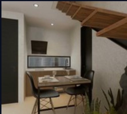
Cocina y comedor · planta baja