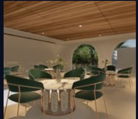
Restaurante comunitario · sillas verdes y mesas de mármol

Las zonas comunes de Verónica Villa combinan arquitectura de curvas orgánicas con materiales nobles — piedra natural, madera tropical y microcemento — creando espacios sociales que elevan la experiencia del huésped al nivel de un resort de alta gama. La recepción opera 24 horas con gestión profesional centralizada que optimiza la ocupación de todas las villas mediante el modelo Rental Pool.